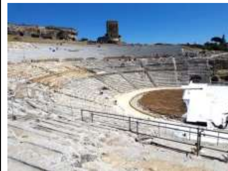
Siracusa - Anfiteatro greco