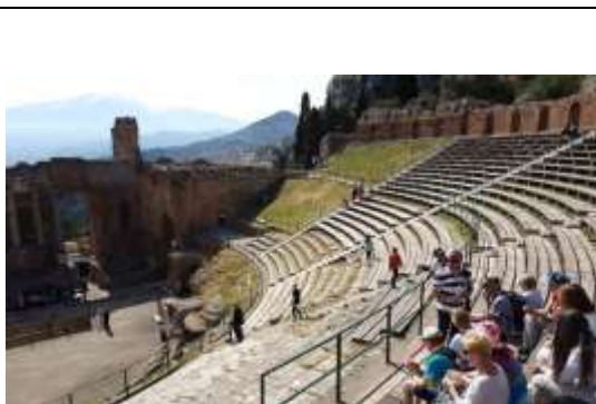
Taormina - Anfiteatro greco romano