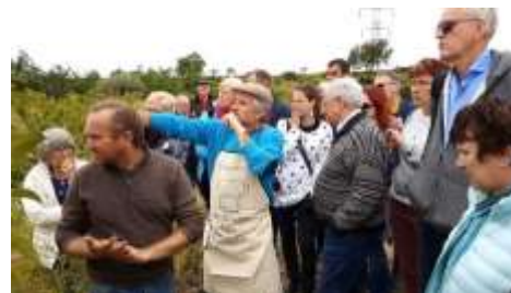
L'Azienda agricola Ruvitello a Misterbianco