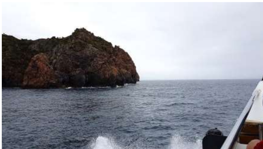
Le Isole Eolie (isole vulcaniche)