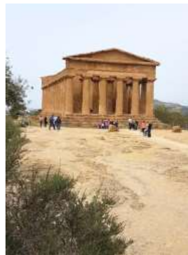
Agrigento Tempio della Concordia