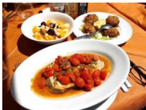
Pesce spada ai pomodorini