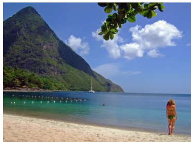
Isola Saint Lucia

di affetto e devozione. In Europa è conosciuta e venerata da una moltitudine di fedeli e molte donne vengono battezzate con questo nome. In Brasile c'è una città chiamata Santa Lucia, così pure in Africa, nel gruppo delle Isole di Capoverde. Negli Stati Uniti d'America, la città di Syracuse ha scelto per patrona santa Lucia: una scelta fatta anche da altre città nel resto del mondo.