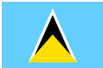
Bandiera dell'Isola Saint Lucia

La devozione a santa Lucia è estesa a tutto il mondo cristiano. Non vi è nazione o città che non abbia una chiesa, un altare, un oratorio, una reliquia, una statua, un dipinto che ricordi e celebri la santa martire siracusana. Specialmente il 13 dicembre , giorno della sua festa, è venerata ovunque con sacre funzioni ed altre manifestazioni