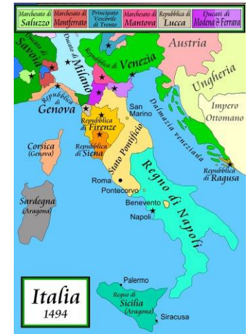
Italia, anno 1494