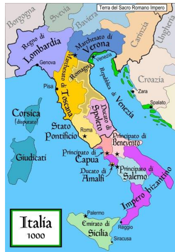
Italia, anno 1000