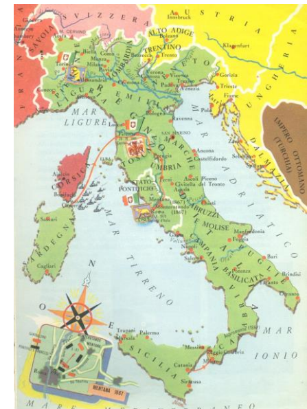
Risorgimento : unificazione italiana 1861-1878