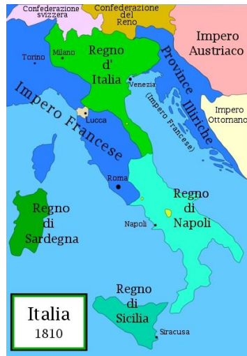
Italia, anno 1810