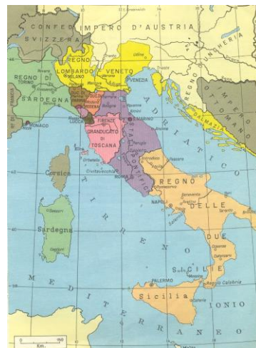
Risorgimento : l'Italia nel 1815, dopo il congresso di Vienna