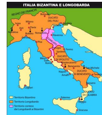
Italia intorno al 750