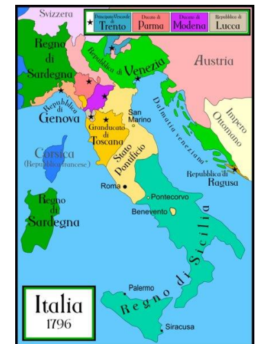
Italia, anno 1796