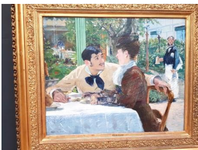
Edouard Manet - Chez le Père Lathuile