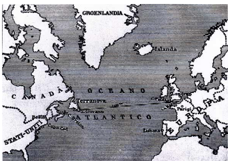
Posizione geografica di Saint John's di Terranova e Poldhu (Cornovaglia), i due punti collegati da Marconi nel 1901 con la telegrafia senza fili.

come antenna dispone di un insieme di fili sospesi a ventaglio fra due alberi a 45 metri d'altezza, mentre la stazione ricevente, posta a St. Johns di Terranova, è composta solo da un aquilone che porta un'antenna di 120 metri.