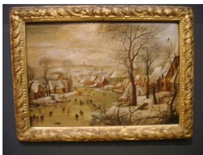
Pierre Breugel - Paesaggio invernale

Vi si possono trovare inoltre, unico caso in tutto il Belgio, due quadri di una bellezza rara di Édouard Manet , (1832-1883) Chez le Père Lathuile (Olio su tela - 1879) e Argenteuil (Olio su tela - Les canotiers - 1874).