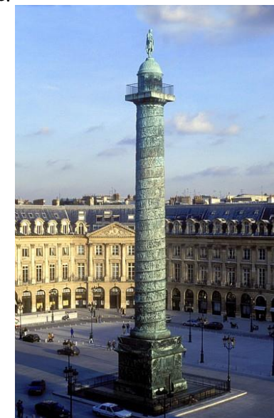
Parigi, Place Vendôme La statua di Napoleone

Poi venne a dire, come leggendo le storie egli aveva fatto il conto che l'Italia produceva anticamente sessanta mila cavalli da guerra, e si confondeva di non trovarveli oggi : — Perchè l'Italia oggi non dà sessanta mila cavalli ? — Qui un interlocutore allegò i cavalli di lusso ; ma Napoleone, non badando alla risposta, ci voltò le spalle e pensò qualche istante, poi rinnovò la domanda. Un altro interlocutore diede un'altra risposta, credo la diminuzione di terre a pastura. E Napoleone ripetendo il solito gioco, ricominciò poi la stessa domanda.