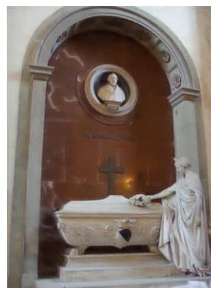
Firenze - Chiesa di Santa Croce, monumento funebre di Gino Capponi

Fautore dell'annessione della Toscana al Piemonte, fu nominato senatore del nuovo Regno d'Italia nel 1860 e partecipò attivamente alla vita parlamentare fino al 1864.