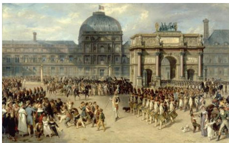
Hippolyte Bellangé Un jour de revue sous l'Empire - 1810

Qui m'attirava sopra ogni altra cosa quel gran nome di Napoleone, nel quale era tanta storia; e poiché allora certe grandezze a me parevano anche troppo belle, poteva essermi più istruttivo l'averlo veduto oramai prossimo a cadere, che nel prestigio dell'onnipotenza.