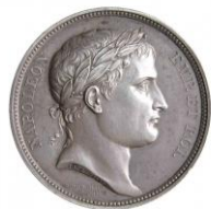
Napoleone - Moneta

N. (sorridendo) Oh! oui, vous êtes maintenant fort tranquilles, vous êtes les meilleurs sujets que j'aie.