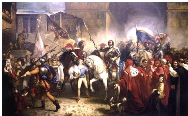
Entrata di Carlo VIII a Firenze, il 17 novembre 1494. Olio su tela (1825) di Giuseppe Bezzuoli, Galleria d'arte moderna, Firenze

Dino Compagni, grande cronista fiorentino dell'epoca: « A quei tempi infausti io, Dino Compagni, fu eletto Priore il 15 ottobre 1301. Credevamo ancora di poter mettere tutti d'accordo. Parlavamo ai Guelfi neri, cercando di convincerli a fare la pace, a dividere il potere con i Bianchi. Insistevamo a trattare per la pace. Quando invece conveniva arrotrare i ferri ».