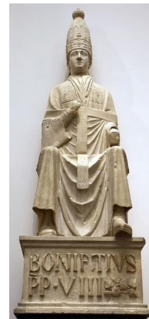
Papa Bonifacio VIII

Poco dopo l'arrivo dell'inviato del Papa, sono entrati in carica i sei Priori che dovevano governare dal 15 giugno al 14 agosto. Per essere nominati in un momento così delicato, dovevano essere uomini di cui il regime popolare si fidava completamente. Alcuni erano Bianchi e altri Neri e tra quei sei in quota ai Bianchi, c'era Dante . Insomma Dante era arrivato al vertice della sua carriera politica, è arrivato al potere anche se soltanto per due mesi, in un momento diffici-